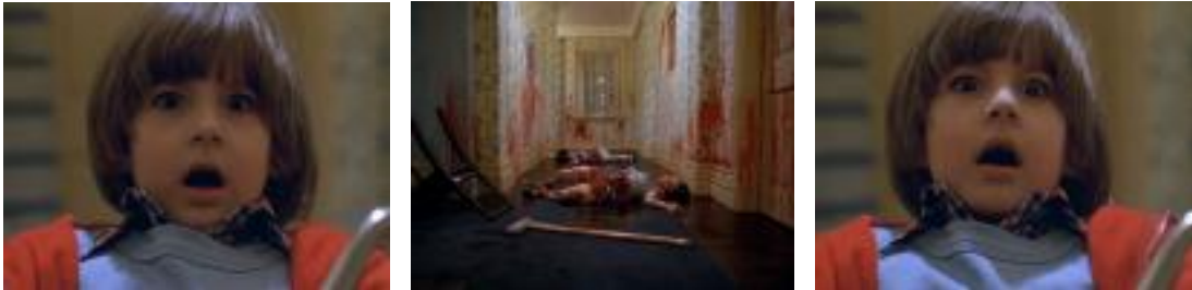
SHINING, Stanley Kubrick, 1980

Le gore fonctionne à l'inverse : il s'agit bien de donner le contrepoint, et plusieurs fois, et d'en faire le centre de l'horreur. Le spectateur, dans le cinéma gore, partage la terreur du personnage.