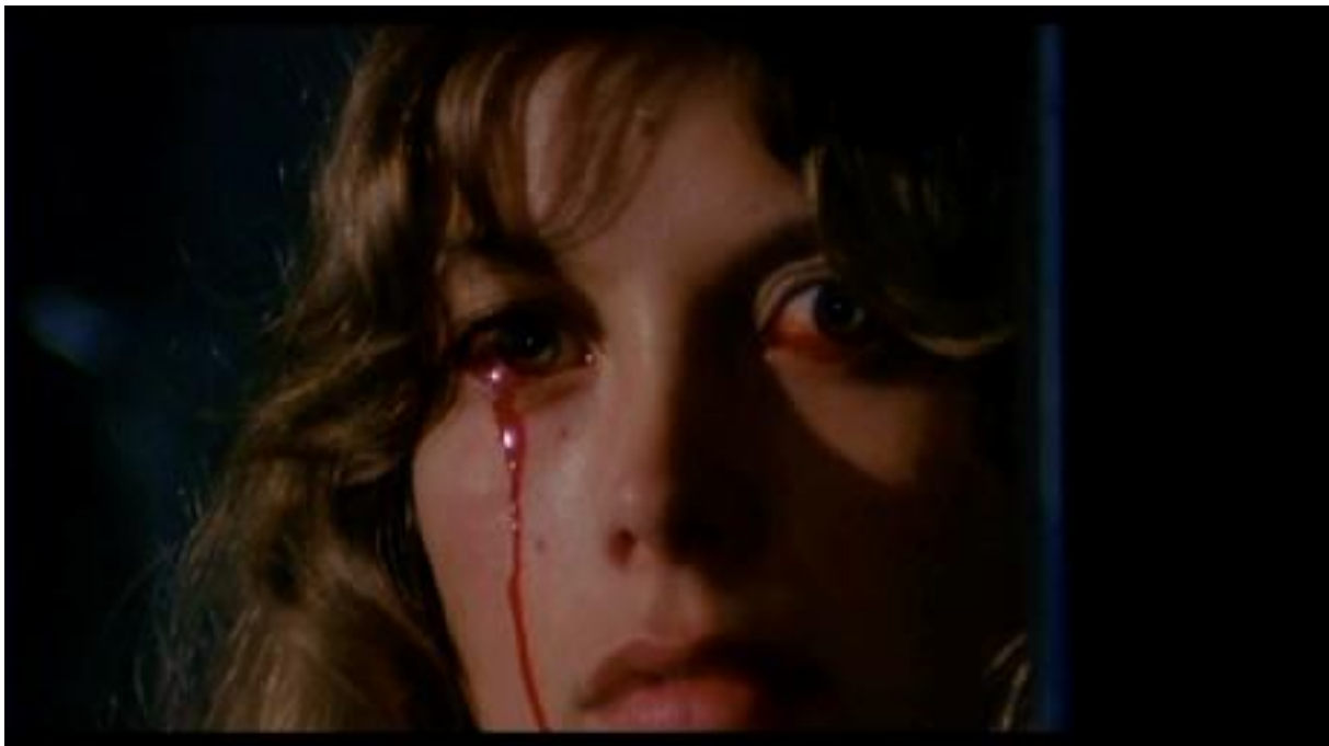
FRAYEURS, Lucio Fulci, 1980