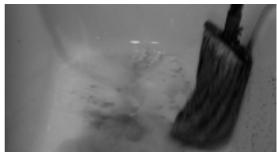
PSYCHOSE, Alfred Hitchcock, 1960