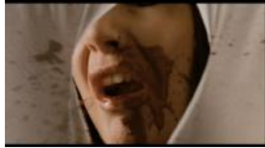
TENEbres, Dario Argento, 1982