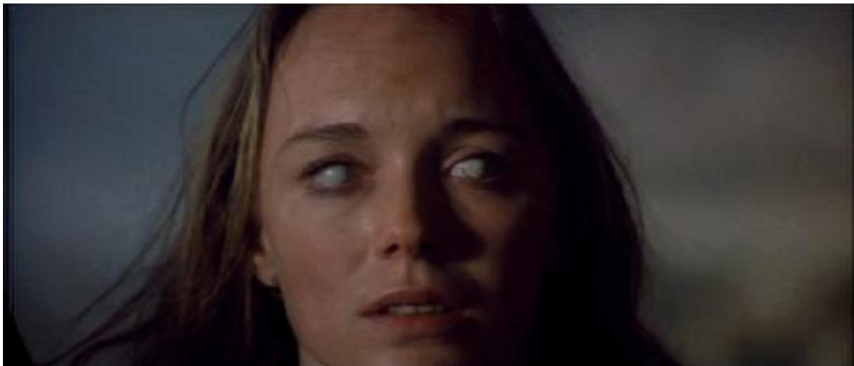
L'AU DELA, Lucio Fulci, 1981