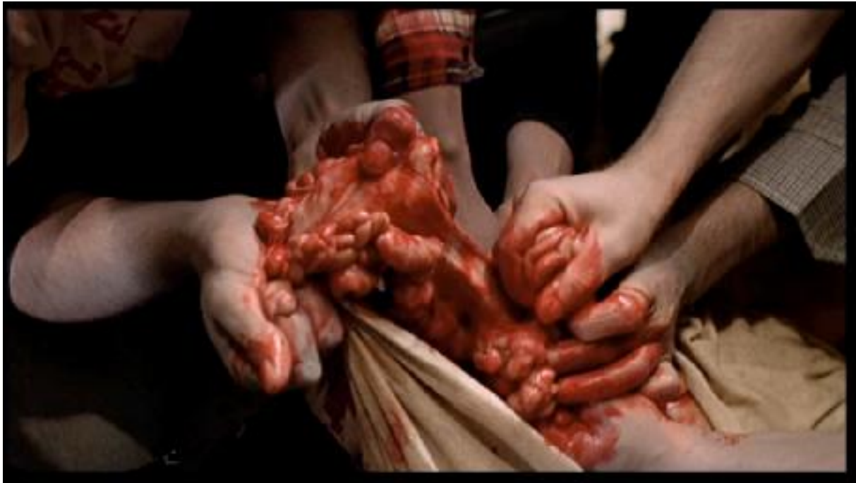
ZOMBIE, George Romero, 1983 (1978 pour le montage américain)