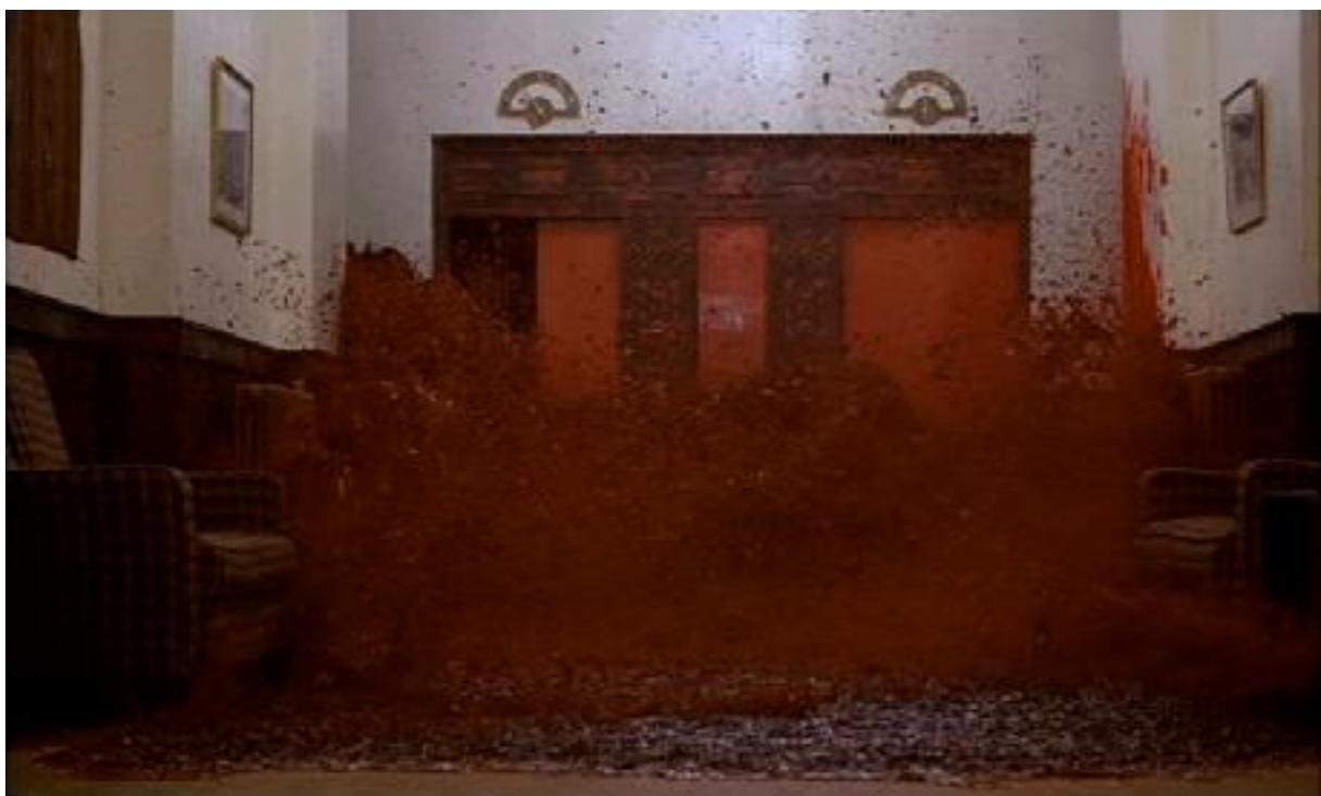
SHINING, Stanley Kubrick, 1980