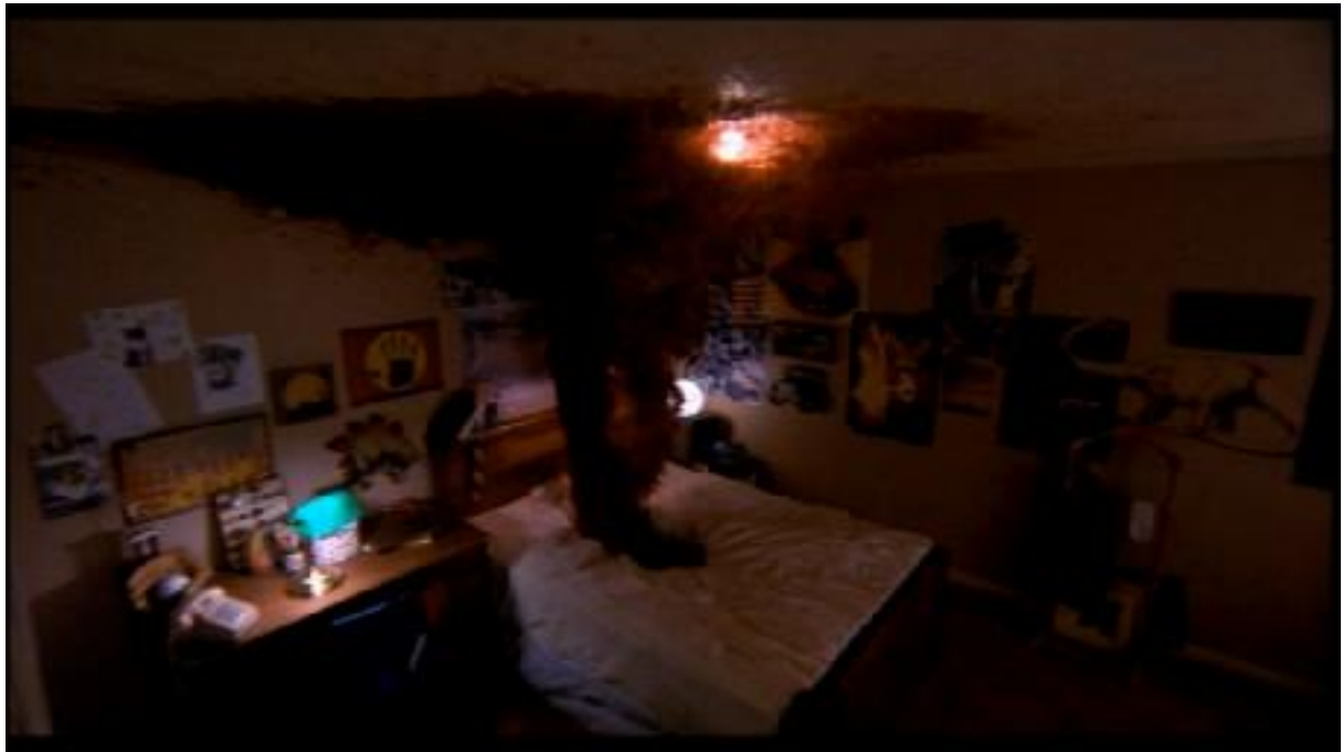
NIGHTMARE ON ELM STREET, Wes Craven, 1984