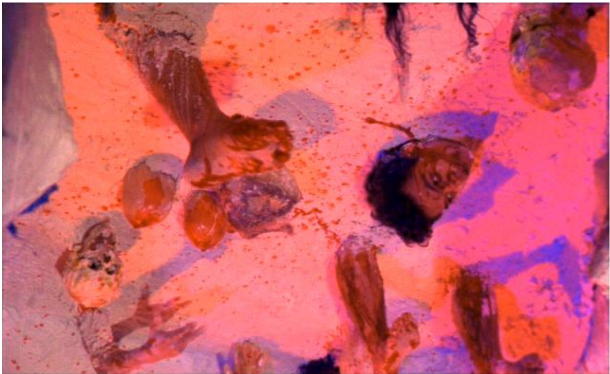
ESTA NOITE ENCARNAREI NO TEU CADAVER, José Mojica Marins, 1966