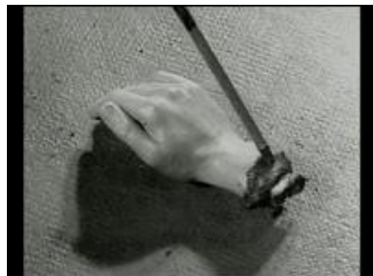
UN CHIEN ANDALOU, Luis Buñuel, 1929