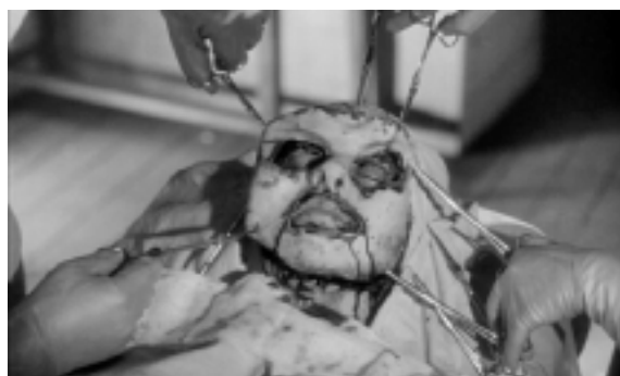
voir derrière la peau : LES YEUX SANS VISAGE (1960) de Georges Franju

Voilà sans doute une des clefs du cinéma gore. On l'a vu, le réalisme est une des données nécessaires du gore. Mais sans poésie, sans distance onirique, le gore se perd peut-être dans la dimension, historique certes, mais réductrice, du grand-guignol 9 .