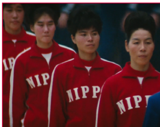
Les Sorcières de l'Orient de Julien Faraut