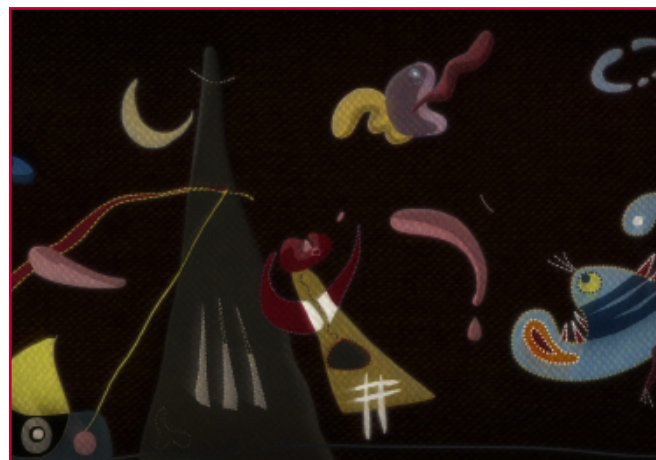
Sonàmbulo de Theodore Ushev