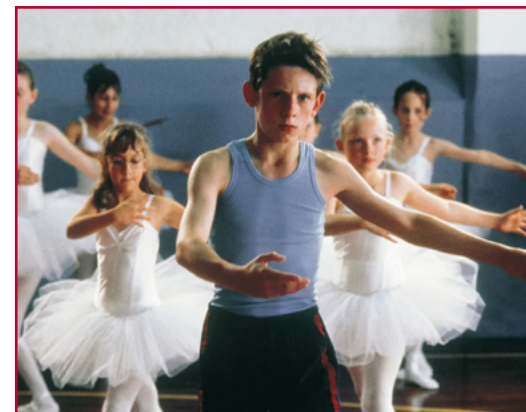
Billy Elliot de Stephen Daldry