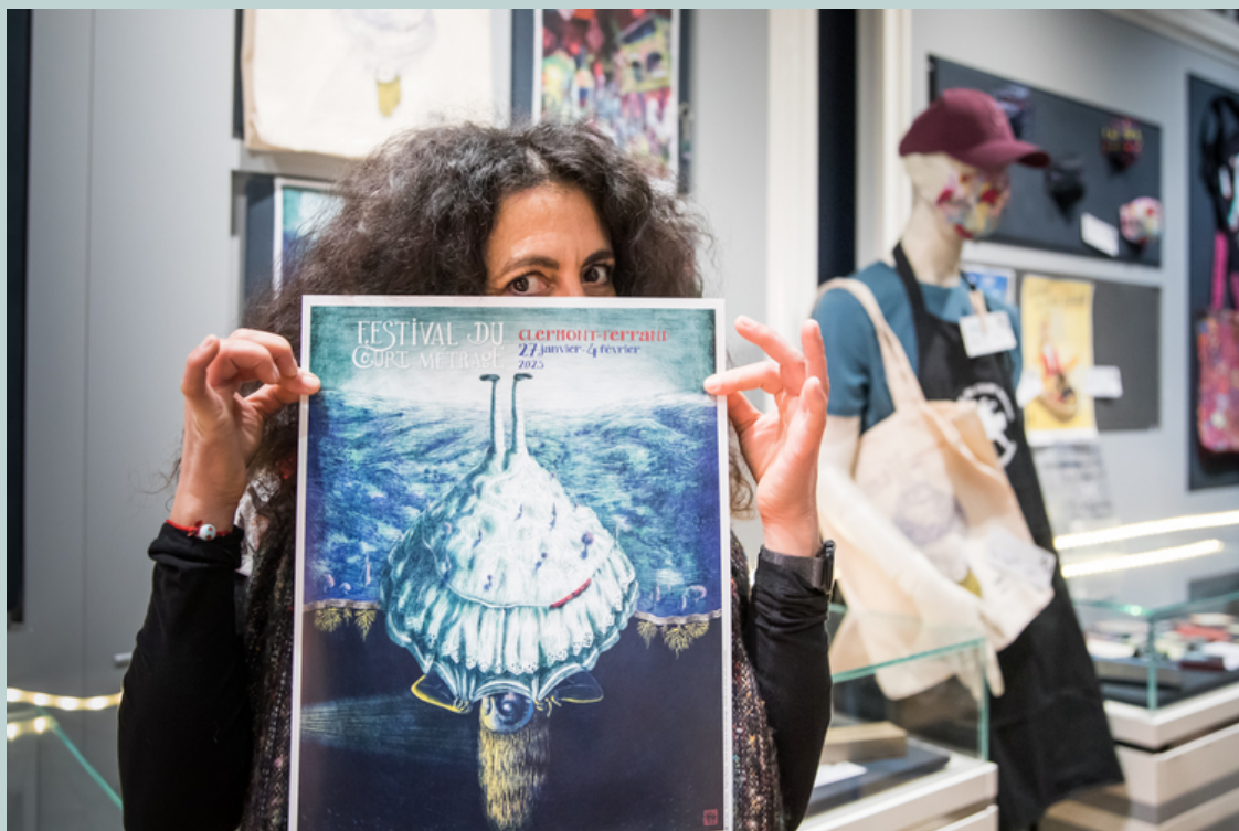
L'illustratrice et réalisatrice de films d'animation Regina Pessoa, cachée derrière son affiche